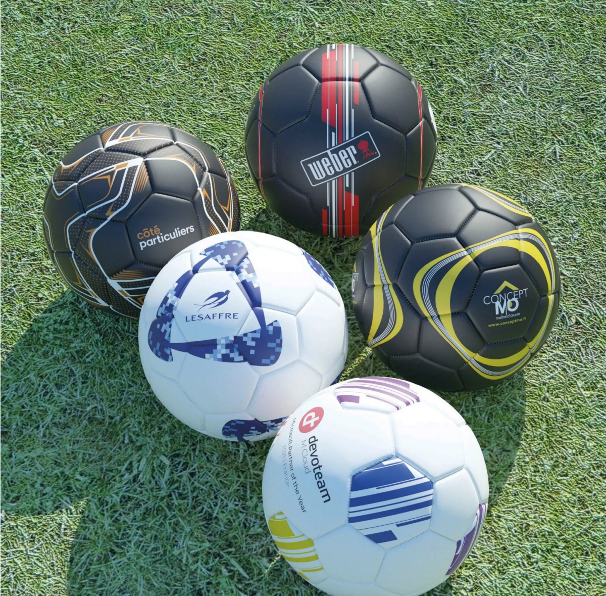
Visuel non contractuel, marquages donnés à titre d'exemples.